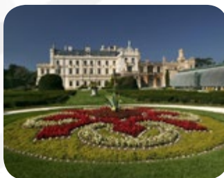
Kulturlandschaft Lednice-Valtice - zum Weltkulturerbe gehörende Landschaftsarchitektur mit den Schlössern Lednice und Valtice - einen Tagesausflug wert, ca. 35 km von Hodonin.