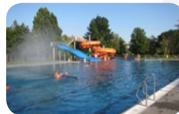
Schwimmbad - eines der modernsten Freibäder Tschechiens mit Riesenrutschen, Sprungturm, Schwimmer, Nichtschwimmer und Planschbecken - 1 km vom Zentrum.