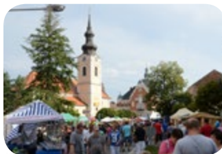
Hodonin - Zentrum der lebendigen Bezirkshauptstadt mit vielen Kulturdenkmälern.