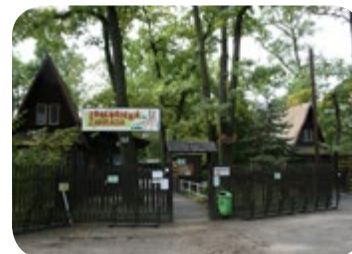
Zoo Hodonin - ein kleiner Zoo für kleinere Kinder mit einheimischen und exotischen Tieren - 1 km von der Penzion Lipovka.