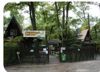
Zoo Hodonin - ein kleiner Zoo für kleinere Kinder mit einheimischen und exotischen Tieren - 1 km von der Penzion Lipovka.