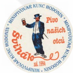
Mikrobrauerei Kunc - traditionelle Esskultur und schmackhaftes selbstgebrautes Bier - direkt im Zentrum.