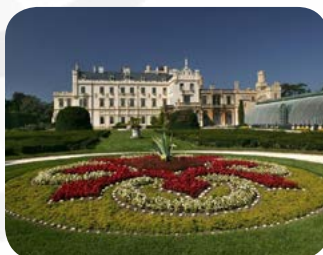
Kulturlandschaft Lednice-Valtice - zum Weltkulturerbe gehörende Landschaftsarchitektur mit den Schlössern Lednice und Valtice - einen Tagesausflug wert, ca. 35 km von Hodonin.