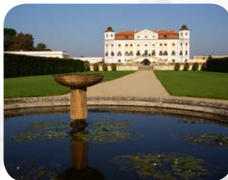
Schloss Milotice - hochbarockes Wasserschloss - nur eine Viertelstunde mit dem Auto von Hodonin entfernt.