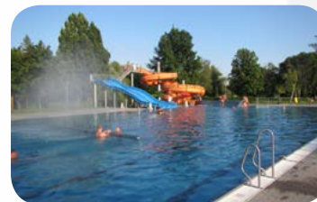
Schwimmbad - eines der modernsten Freibäder Tschechiens mit Riesenrutschen, Sprungturm, Schwimmer, Nichtschwimmer und Planschbecken - 1 km vom Zentrum.