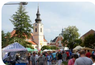
Hodonin - Zentrum der lebendigen Bezirkshauptstadt mit vielen Kulturdenkmälern.