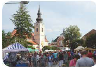
Hodonin - Zentrum der lebendigen Bezirkshauptstadt mit vielen Kulturdenkmälern.