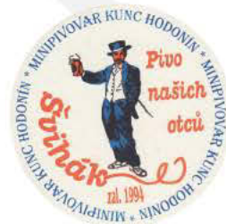
Mikrobrauerei Kunc - traditionelle Esskultur und schmackhaftes selbstgebrautes Bier - direkt im Zentrum.