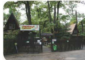
Zoo Hodonin - ein kleiner Zoo für kleinere Kinder mit einheimischen und exotischen Tieren - 1 km von der Penzion Lipovka