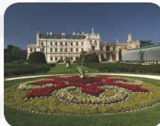
Kulturlandschaft Lednice-Valtice - zum Weltkulturerbe gehörende Landschaftsarchitektur mit den Schlössern Lednice und Valtice - einen Tagesausflug wert, ca. 35 km von Hodonin.