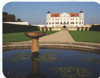
Schloss Milotice - hochbarockes Wasserschloss - nur eine Viertelstunde mit dem Auto von Hodonin entfernt.