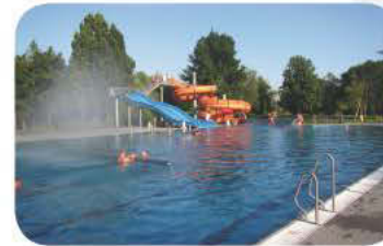
Schwimmbad - eines der modernsten Freibäder Tschechiens mit Riesenrutschen, Sprungturm, Schwimmer, Nichtschwimmer und Planschbecken - 1 km vom Zentrum.